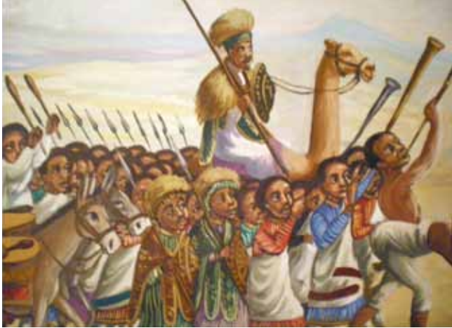
Speglar delar av den Etiopiska hären som slog tillbaka Italienska armén i Adwa 1896. Detta historiska slag firas fortsatt med en helgdag. Etiopien är ett av två länder i Afrika som aldrig varit koloniserat.

Denna gång tar jag till orda från Addis Ababa i Etiopien, där jag under några månader arbetar för svenska Röda Korset med samordning av hjälpinsatser efter förra årets stora torkkatastrof och även med de mer